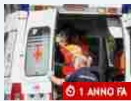
Cronaca Sulla Ceva-Lesegno una moto centra un capriolo: due feriti