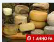
Agricoltura Cuneo per tre giorni diventa la capitale del formaggio