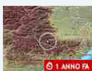
Cronaca Terremoto nelle Alpi Marittime: la terra trema a Aisone, Demonte e Vinadio